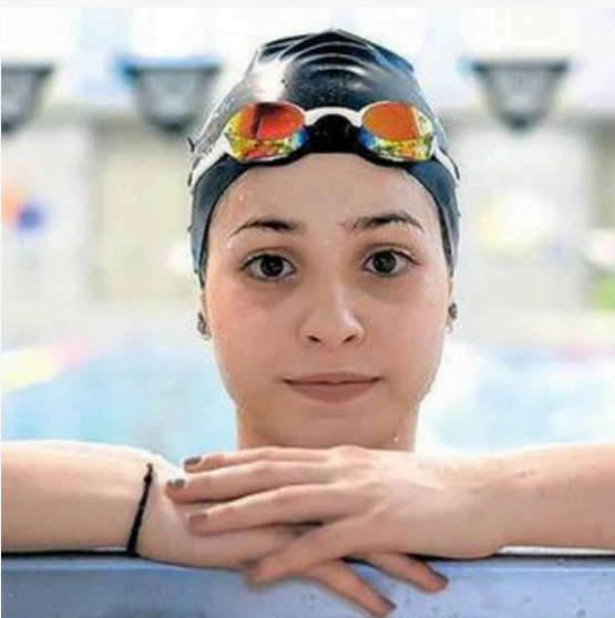
Yusra Mardini, Siria